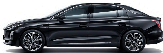
أسود Polar Night Black