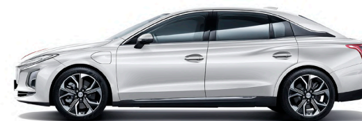
أبيض Luster White