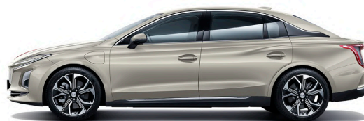
ذهبي Champion Gold